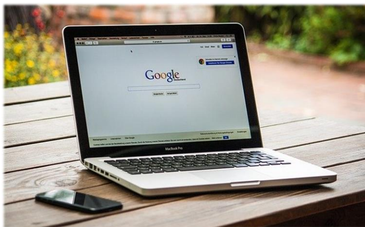
Ilustracja nr 2