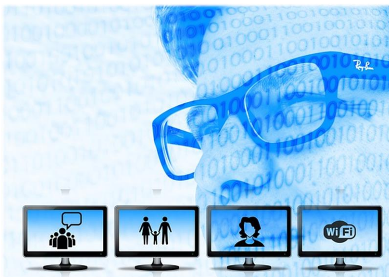
Ilustracja nr 1

Profil cyfrowy pracownika, przedsiębiorcy i firmy, to, ogólnie rzecz ujmując, wszystko, co można znaleźć w internecie o pracowniku/przedsiębiorcy/firmie . Dotyczy to informacji zawodowych i prywatnych. Informacje te nie muszą być udostępnione przez Państwa, mogą być również udostępnione przez osoby obce. Dlatego warto się zastanowić zanim udostępnicie coś Państwu w internecie lub dacie do dyspozycji osobie trzeciej.